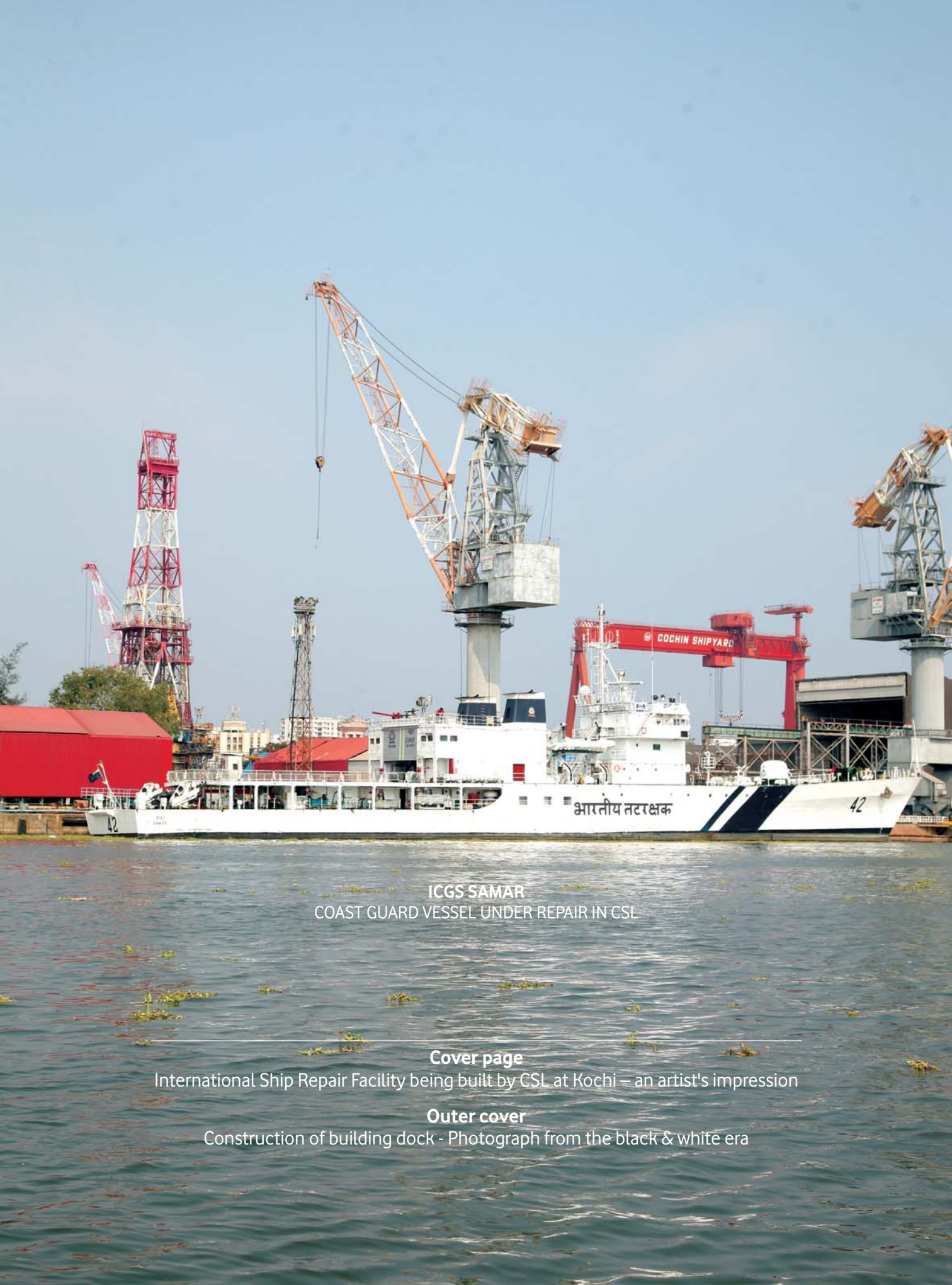
ICGS SAMAR COAST GUARD VESSEL UNDER REPAIR IN CSL

International Ship Repair Facility being built by CSL at Kochi – an artist's impression