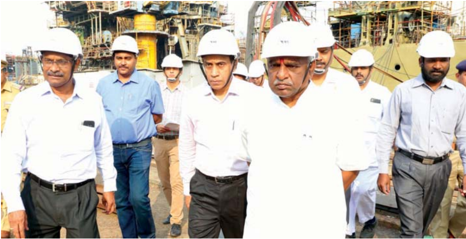
Shri Pon Radhakrishnan, Honourable Minister of State for Shipping & Finance, on his visit to CSL after the accident.

WE ARE INDEBTED TO ALL THOSE WHO STOOD BY US AND PROVIDED UNSTINTED SUPPORT AND COURAGE DURING THOSE DIFFICULT AND TESTING TIMES. THEY BOOSTED OUR SHAKEN MORALE