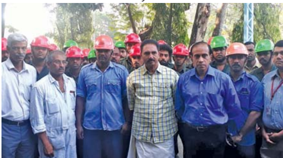
Shri N.K. Premachandran, hon'ble MP in the yard along with CSL team