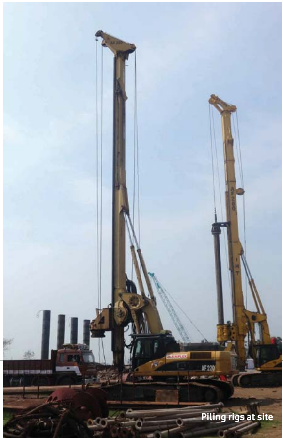
Piling rigs at site

M/s SIL had completed the site enabling works to a major extend. 2 nos. Batching plant, site office, lab, weigh bridge etc had been set up by M/s SIL at project site. Erection of two nos. gantry cranes for pre-cast yard is also completed. Ground investigation at land side completed and the same at marine side is in progress. Four hydraulic rigs were mobilized till now. Mobilization of the balance 3 nos. rigs is in progress. Land side piling activities commenced and as on date 58 nos. piles are casted. Piling gantry for carrying out marine side piling is ready to commence the work. Gate replacement of the existing dry dock is also in progress.